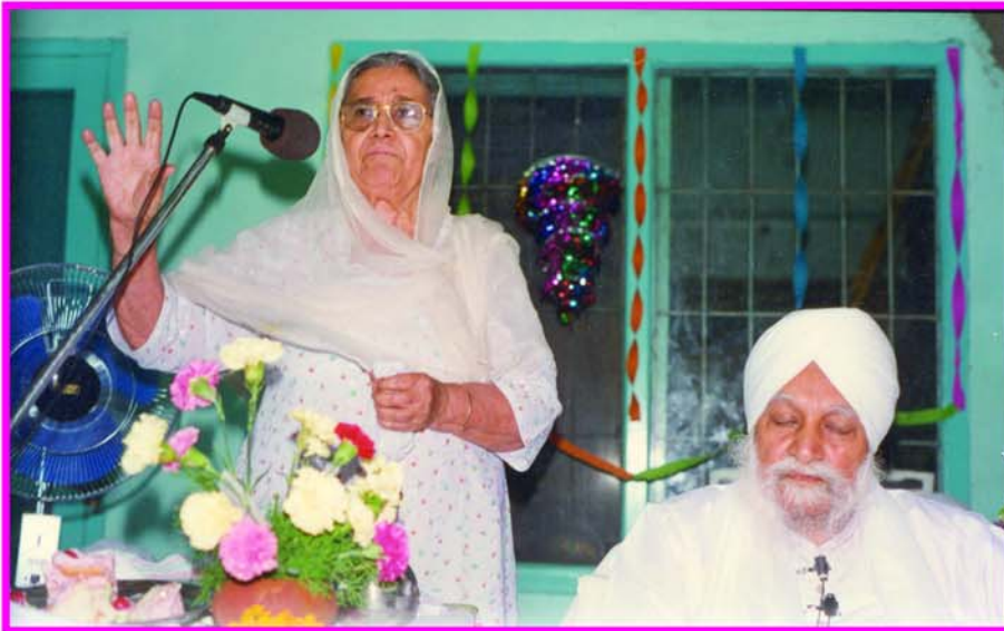
ਸਤਿਕਾਰਯੋਗ ਮਾਤਾ ਜੀ ਪ੍ਰਵਚਨ ਕਰਦੇ ਹੋਏ।

ਸੰਗਤ ਦੀ ਸੇਵਾ ਤੋਂ ਇਲਾਵਾ, ਆਏ ਗਏ ਸਾਧੂ ਸੰਤਾਂ ਦੀ ਸੇਵਾ ਕਰਨ ਦਾ ਸੁਭਾਅ ਵੀ ਉਨ੍ਹਾਂ ਨੂੰ ਆਪਣੇ ਪਿਤਾ ਪੁਰਖੀ ਵਿਰਸੇ ਵਿਚੋਂ ਮਿਲਿਆ ਹੋਇਆ ਸੀ। ਇਨ੍ਹਾਂ ਭਾਵਾਂ ਦਾ ਪ੍ਰਗਟਾਵਾ ਕਰਦੇ ਹੋਏ ਜਗਤ ਪ੍ਰਸਿੱਧ ਡਾ. ਸੁਆਮੀ ਰਾਮ ਜੀ ਜਦੋਂ ਪੰਜਵੇਂ ਗੁਰਮਤਿ ਸਮਾਗਮ ਦੌਰਾਨ ਰਤਵਾੜਾ ਸਾਹਿਬ ਆਏ ਸੀ ਤਾਂ ਉਨ੍ਹਾਂ ਨੇ ਆਪਣੇ ਪ੍ਰਵਚਨਾਂ ਰਾਹੀਂ ਇਨ੍ਹਾਂ ਸ਼ਬਦਾਂ ਦੁਆਰਾ ਬੀਜੀ ਨੂੰ ਸਲਾਹਿਆ - 'ਕਿਨ ਸ਼ਬਦੋਂ ਸੇ ਮੈਂ ਆਪਣੀ ਮਾਂ (ਬੀਜੀ) ਕਾ ਪੰਨਵਾਦ ਕਰੂੰ, ਜੋ ਹਰ ਦੋ ਮਿੰਟ ਬਾਅਦ ਮੁਝੇ ਖਿਲਾਤੀ ਹੈ; ਮੈਨੇ ਕਹਾ, ਮਾਂ! ਮੇਰੇ ਪੇਟ ਮੈਂ ਕੋਈ ਜਗਹ ਨਹੀਂ ਹੈ। ਬੋਲੇ ਬੋੜਾ ਸਾ ਔਰ ਖਾ ਲੋ। ਕਿਉਂਕਿ ਮੈਨੇ ਤੋਂ