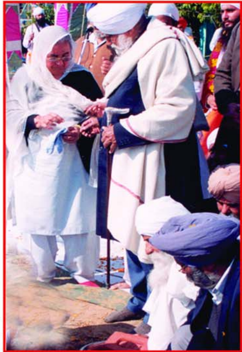
ਗੁਰਦੁਆਰਾ ਈਸ਼ਰ ਪ੍ਰਕਾਸ਼ ਰਤਵਾੜਾ ਸਾਹਿਬ ਦੀ ਨੀਂਹ ਰੱਖਣ ਸਮੇਂ ਪਿਆਰੇ ਮਹਾਂਪੁਰਖ ਅਤੇ ਸਤਿਕਾਰਯੋਗ ਮਾਤਾ ਜੀ ।

ਵੱਡੇ ਮਹਾਰਾਜ ਜੀ ਰਾੜਾ ਸਾਹਿਬ ਵਾਲਿਆਂ ਦਾ ਹੁਕਮ ਪਾ ਕੇ ਜਦੋਂ ਮਹਾਂਪੁਰਖ ਦਿੱਲੀ ਤੋਂ ਵਾਪਸ ਪਟਿਆਲੇ ਆਏ ਤੇ ਫੌਜ ਦੀ ਸਰਵਿਸ ਕੀਤੀ ਤਾਂ ਬੀਬੀ ਜੀ ਵੀ ਪਟਿਆਲੇ ਆ ਗਏ ਤੇ ਉਸ ਤੋਂ ਬਾਅਦ ਚੰਡੀਗੜ੍ਹ ਆ ਗਏ। ਰਾੜਾ ਸਾਹਿਬ ਵਾਲੇ ਵੱਡੇ ਮਹਾਰਾਜ ਜੀ ਦੇ ਦੀਵਾਨ ਹਰ ਸਾਲ ਚੰਡੀਗੜ੍ਹ ਲਗਦੇ ਸਨ। ਇਹ ਉਪਰਾਲਾ ਮਹਾਂਪੁਰਖਾਂ ਦੇ ਉਦਮ ਤੇ ਪਰਉਪਕਾਰੀ ਸੁਭਾਅ ਵਸ ਹੁੰਦਾ ਸੀ ਤਾਂ ਜੋ ਇਥੇ ਵੀ ਸੰਗਤਾਂ ਦਾ ਭਲਾ ਹੋਵੇ। ਉਸ ਦੌਰਾਨ ਮਹਾਰਾਜ ਜੀ ਆਪ ਦੇ ਗ੍ਰਹਿ ਵਿਖੇ ਹੀ ਠਹਿਰਦੇ ਤੇ ਉਚੇਚੇ ਤੌਰ ਤੇ ਉਨ੍ਹਾਂ ਲਈ ਨਿਵੇਕਲੀ ਰਿਹਾਇਸ਼ ਦਾ ਇੰਤਜ਼ਾਮ ਕਰਦੇ ਤੇ ਲੰਗਰ ਪ੍ਰਸ਼ਾਦੇ ਦੀ ਸਾਰੀ ਜ਼ਿੰਮੇਵਾਰੀ ਬੀਜੀ ਦੀ ਹੁੰਦੀ ਸੀ। ਇਹ ਦਿਨ ਰਾਤ ਇਕ ਕਰਕੇ ਸੰਗਤਾਂ ਦੀ ਸੇਵਾ ਵਿਚ ਜੁਟੇ ਰਹਿੰਦੇ। ਭਾਵੇਂ ਉਸ ਵੇਲੇ ਮਹਾਂਪੁਰਖਾਂ ਦੀ ਆਮਦਨ ਵੀ ਐਨੀ ਨਹੀਂ ਸੀ ਪਰ ਫਿਰ ਵੀ ਦਿਲ ਵਿਚ ਚਾਅ ਤੇ ਅਤਿਅੰਤ ਸ਼ਰਧਾ ਹੋਣ ਕਰਕੇ ਕਰਜ਼ਾ ਲੈ ਕੇ ਸੇਵਾ ਦਾ ਆਹਰ ਕਰਦੇ ਤੇ ਸਾਰਾ ਸਾਲ ਕਰਜ਼ਾ ਉਤਾਰਦੇ ਰਹਿੰਦੇ ਤੇ ਜਦੋਂ ਕਰਜ਼ ਉਤਰ ਜਾਂਦਾ, ਫਿਰ